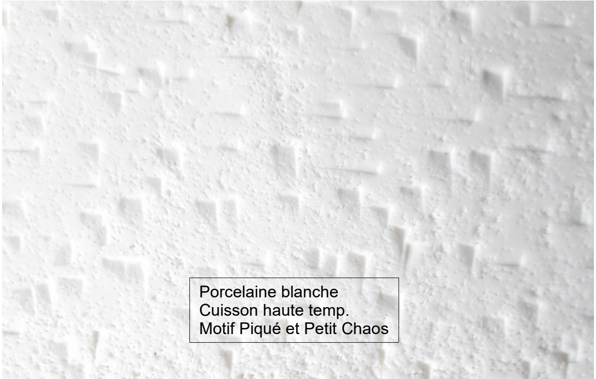
Porcelaine blanche Cuisson haute temp. Motif Piqué et Petit Chaos