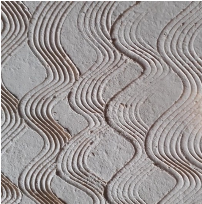
Grès blanc grosse chamotte Cuisson haute temp. Motif Waves