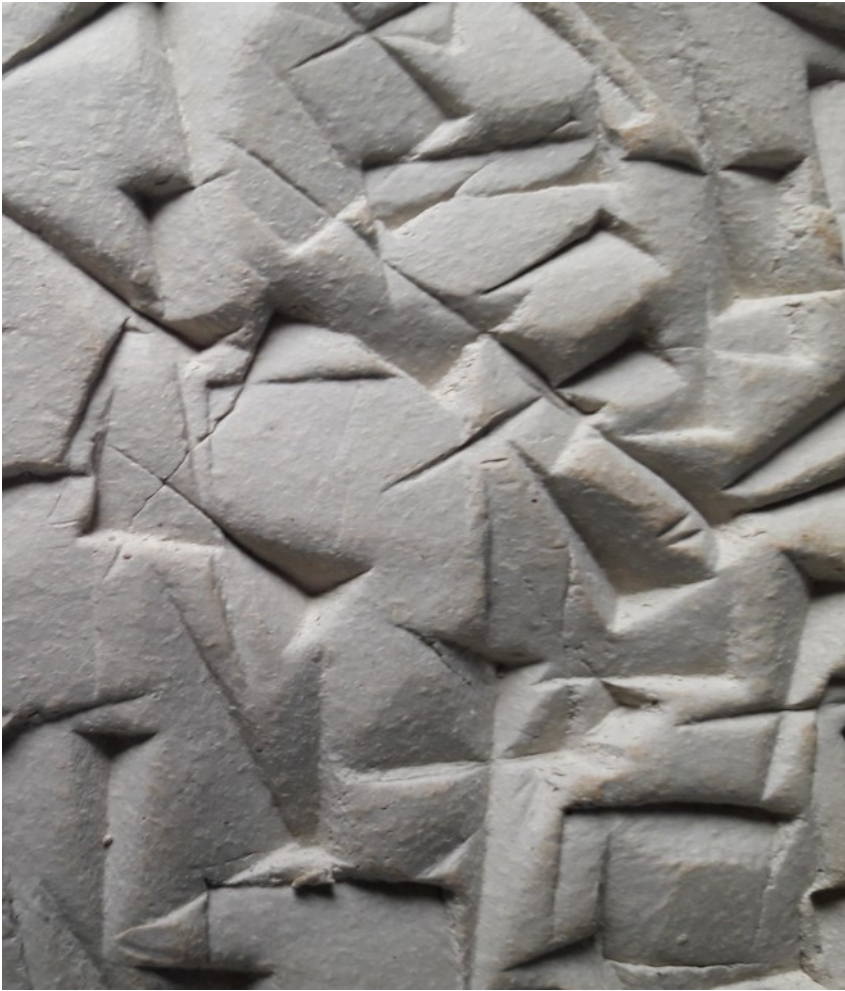
Grès blanc grosse chamotte Cuisson haute temp. Motif Chaos