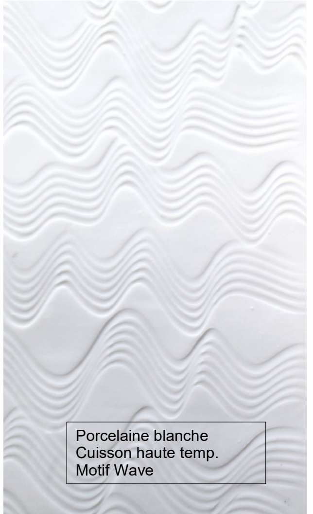
Porcelaine blanche Cuisson haute temp. Motif Wave