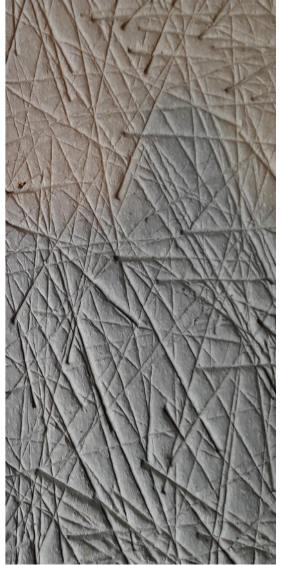
Grès blanc grosse chamotte Cuisson haute temp. Motif Comète